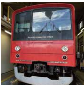
富士急行線 車両装着型 鹿ソニック