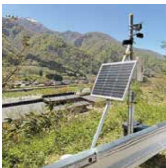
岐阜県 白川村 熊ソニック JK032