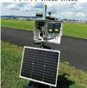
大阪国際空港 バードソニック JK032・JK033