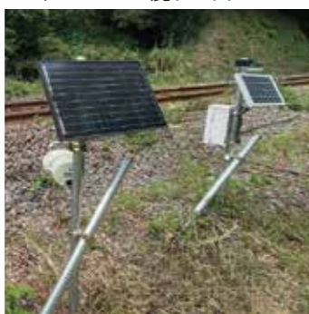
JR東日本 沿線 いのドン JK011 鹿ソニック JK004