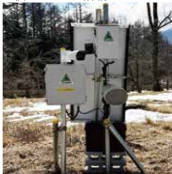
山梨県 デイキャンプ場 AI検知システム搭載 くまドン