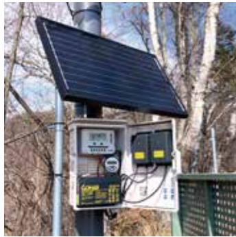
長野県 ホテル 鹿ソニック JK014